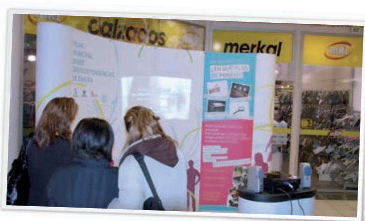
Stand utilizado durante la campaña informativa del PMDZ.

En el año 2008, el PMSD fue invitado por la DGPNSD, tras recibir el 2º premio nacional de prevención comunitaria por el programa “Conduce-te”, a participar en el proyecto internacional “EU-LAC Alianza de Ciudades para el Tratamiento de Drogas”, con el objetivo de trabajar en red en el intercambio de buenas prácticas entre la Unión Europea y países latinoamericanos y caribeños. Fruto del