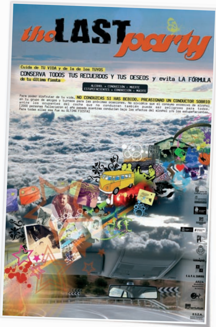
Last Party I, Prevención de accidentes de tráfico por consumo de alcohol y estupefacientes en adolescentes. Ayto. de Zamora · 2005.