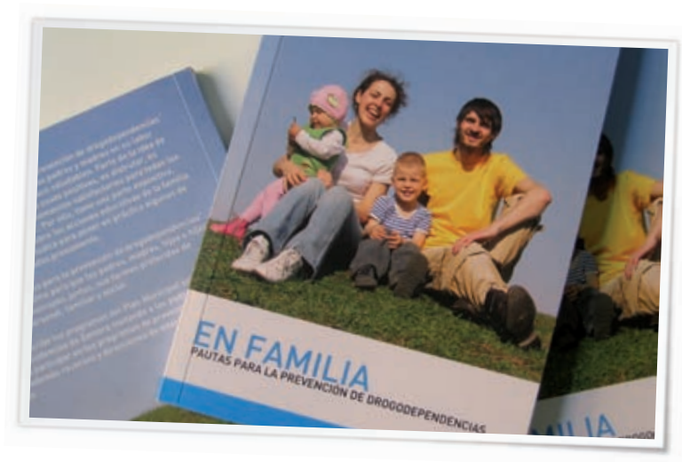
Guía EN FAMILIA.

Por último, dada la relevancia que el tiempo libre presenta en el inicio del consumo de nuestros jóvenes, se hacía patente la necesidad de apoyar a los padres en la educación de un ocio saludable. Desde esta premisa se diseñó un programa que les apoyara y que facilitara el encuentro entre las familias y los recursos de ocio y tiempo libre de la ciudad.