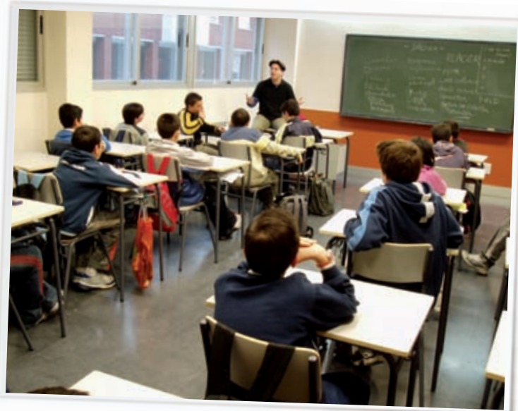
Prevención en el ámbito escolar.

Considerando la importancia de llegar a nuestros jóvenes desde una sinergia de acciones complementarias a través de diferentes ámbitos de intervención, a la vista de la siguiente tabla, podemos apreciar el incremento de centros educativos en los que se desarrollan conjuntamente, en el mismo curso escolar, diferentes programas de prevención: