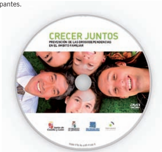
DVD "CRECER JUNTOS". Contenido didáctico para la prevención familiar del consumo.

Con relación a la formación en prevención de drogodependencias en el tiempo libre se han realizado nueve cursos con un total de 165 participantes.