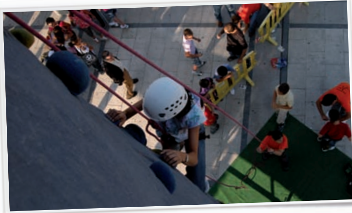
Actividades de Ocio dentro del programa LA COMUNIDAD DE EL SERENO.

En todas las ediciones ha cobrado una gran importancia el Punto de Información sobre Educación para la Salud, principalmente focalizado en la prevención del consumo de drogas.