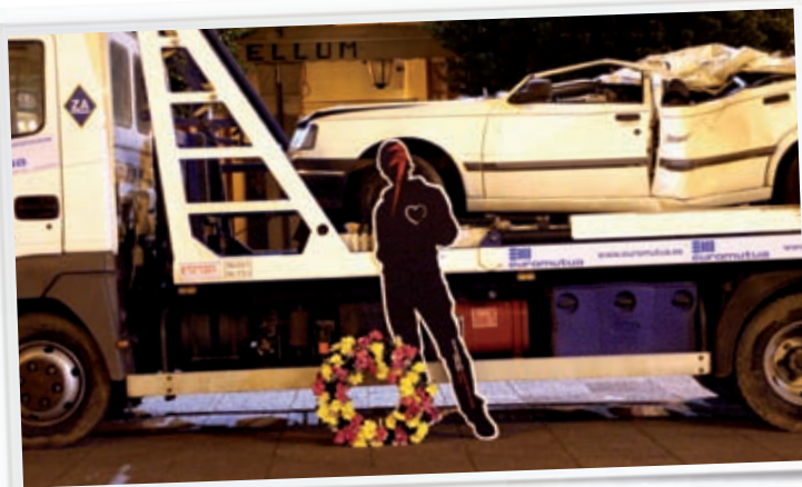
Programa Conduce-te, prevención de accidentes de tráfico por consumo de alcohol.

El programa Conduce-te fue reconocido, a nivel nacional, por la Federación Española de Municipios y Provincias (F.E.M.P.) y la Dirección General del Plan Nacional Sobre Drogas (DGPNSD). Obtuvo el 2º Premio en Prevención Comunitaria dentro de la “II Convocatoria de buenas prácticas en Drogodependencias”, celebrada en el año 2007.